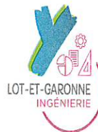
TABLEAU DES EMPLOIS ET DES EFFECTIFS