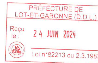
TABLEAU DES EMPLOIS ET DES EFFECTIFS DE LOT-ET-GARONNE INGENIERIE