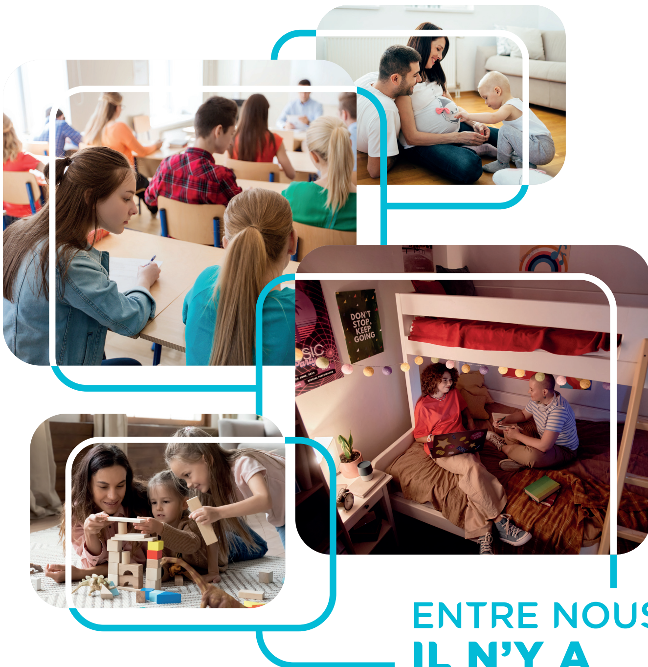
SCHÉMA DÉPARTEMENTAL DE LA PRÉVENTION ET DE LA PROTECTION DE L'ENFANCE (SDPPE) 2026-2030