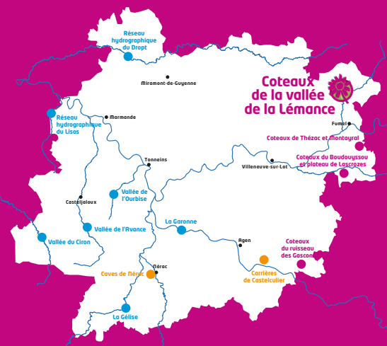
Coteaux de la vallée de la Lémance