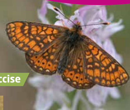
Damier de la Succise