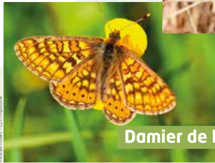
Marc de Pauzet - CEPI Pyrénées