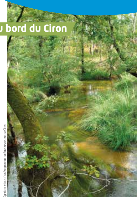
Syndicat mixte d'aménagement du Bassin versant du Ciron