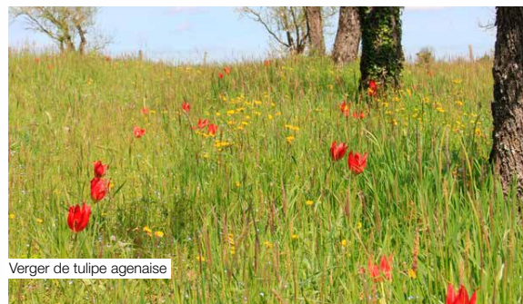
Vergers de tulipe agenaise

La tulipe d'Agen est protégée au niveau national. Il est interdit de la cueillir ou de prélever ses bulbes.