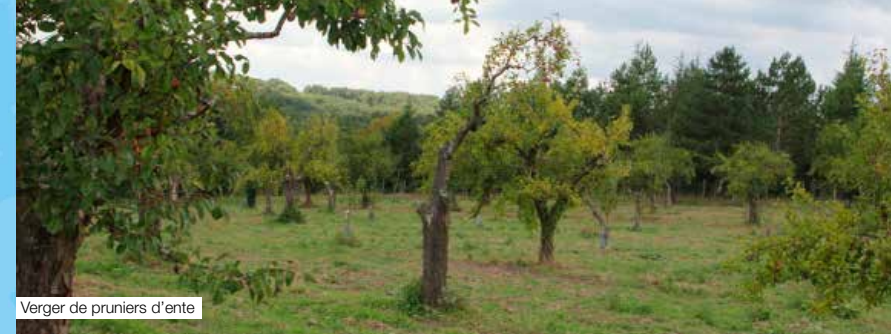
Vergers de pruniers d'ente