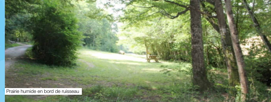
Prairie humide en bord de ruisseau