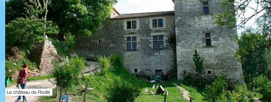
Le château de Rodié