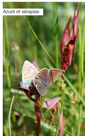
Azuré et sérapias