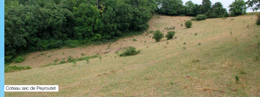
Coteau sec de Peyroutet