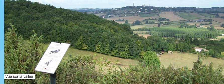
Vue sur la vallée