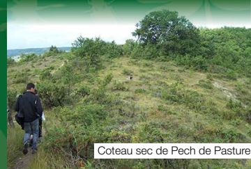
Coteau sec de Pech de Pasture