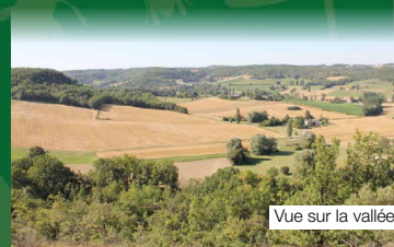
Vue sur la vallée