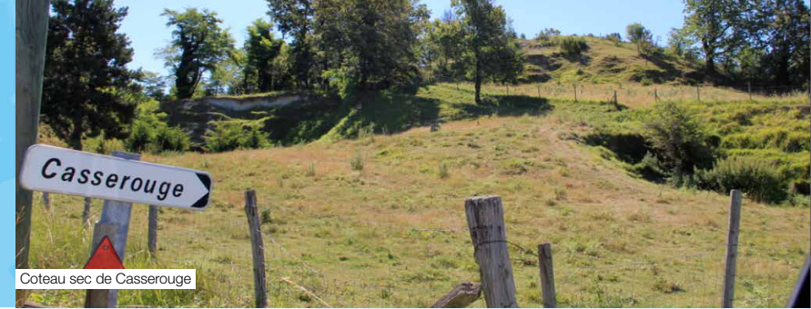
Coteau sec de Casserouge