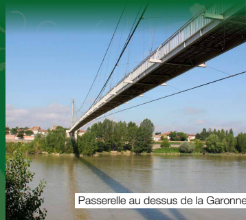
Passerelle au dessus de la Garonne