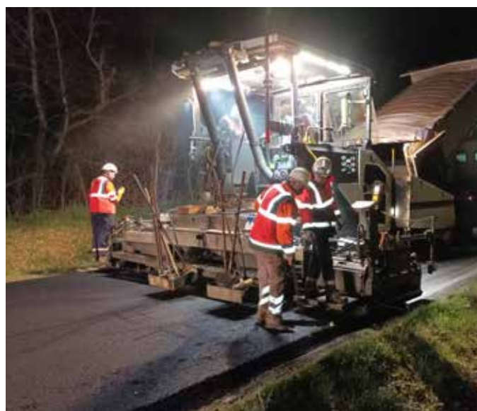
Après les grands projets de modernisation, les efforts seront portés sur les trajets du quotidien et l'intermodalité.

Une vision prospective donc, qui privilégiera une approche globale des déplacements.