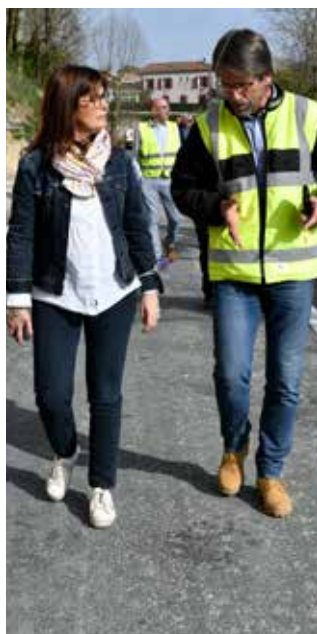
Lors de ses déplacements, la présidente Sophie Borderie a régulièrement l'occasion d'échanger avec les agents des services départementaux sur le suivi des travaux d'entretien et de modernisation du réseau.

Amélioration des trajets quotidiens, sécurité, desserte des bassins de vie, accès aux services... L'objectif est d'établir un programme d'actions, tenant compte des réponses prioritaires à apporter, pour améliorer le réseau routier départemental secondaire et faciliter les déplacements des Lot-et-Garonnais.