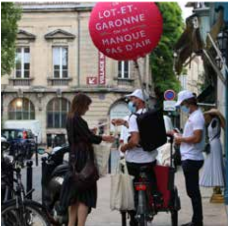
Opération de « street marketing » dans les rues de Bordeaux pour assurer la promotion de la destination Lot-et-Garonne.

Après avoir répondu présent face à l'urgence de la crise sanitaire, le Département vient de voter un plan de soutien exceptionnel à forte dimension durable et inclusive pour encourager la reprise économique. Construites pour être efficaces immédiatement et répondre à l'urgence de la conjoncture, ces mesures, d'un montant global de 1,4 million d'euros, permettent de soutenir des secteurs particulièrement touchés par la crise et relevant des compétences du Département.