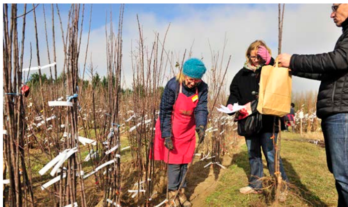
Le Conservatoire végétal régional d'Aquitaine, à Montesquieu, est devenu en novembre dernier le premier Espace Agricole Remarquable labellisé du département.

Ces espaces sont souvent le lieu d'expérimentations agronomiques comme agro-écologiques.