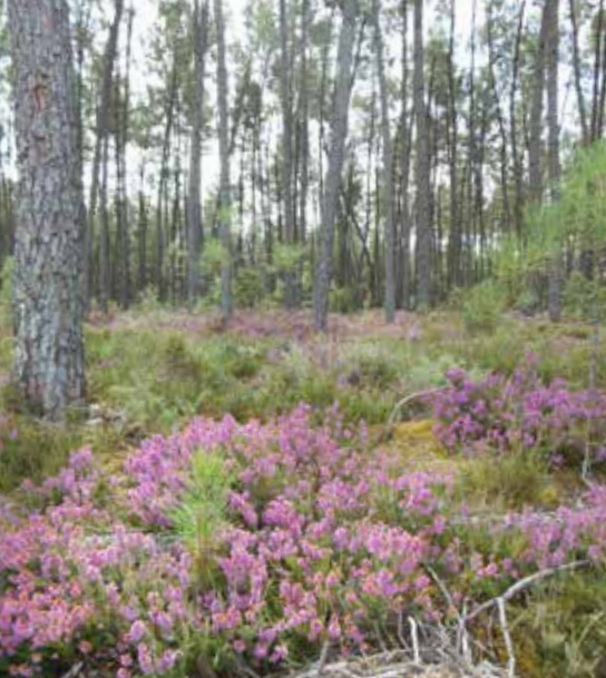
Lande à bruyères