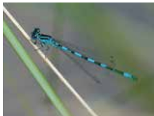
Agrion de Mercure

Le site du Rieucourt est le premier ENS en pleine propriété du Département. Ce site de 34 ha est situé sur la commune de Pindères, à proximité du Center Parcs « Les Landes de Gascogne ».