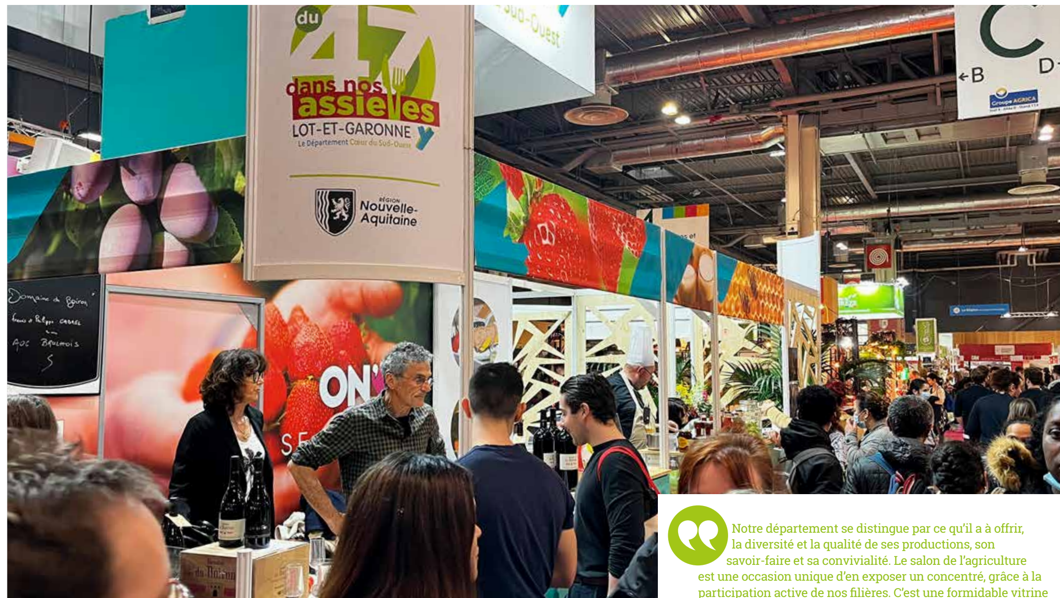
Le stand du Lot-et-Garonne au SIA accueillait de nombreuses filières.

fièrement représentées par l'AIFLG (Association des fruits et légumes du Lot-et-Garonne), les farines, légumineuses et graines d'Alliance bio, qui font partie du programme « Du 47 dans nos assiettes », la pomme Juliet, les Paysans de Rougeline, le pruneau d'Agen par le biais de trois producteurs et de son bureau interprofessionnel, le BIP, ou encore la noisette... Sans oublier le miel de nos apiculteurs, la truffe, la filière vins* (l'Union interprofessionnelle des vins de Bergerac et de Duras, les Vignerons de Buzet, la Fédération des vins Agenais et Côtes du Marmandais, Les Vignerons du Brulhois), le désormais célèbre gin bio* de La Distillerie du Grand Nez ou encore l'Armagnac*, entré au patrimoine culturel immatériel de la France en 2021.