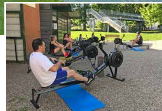
— Aviron agennais

« Depuis la loi de 2016, qui permet aux professionnels de santé de prescrire des activités physiques, les médecins ont bien pris conscience des bienfaits du sport sur la santé. Accompagnée par les docteurs Saint-Béat (médecin du Cdos 47) et Rubio, je sensibilise les professionnels de santé sur le dispositif PEPS. Ils sont ravis d'être conseillés et que je suive les patients pendant leurs séances mais aussi un an après leur prise en charge. Plusieurs médecins m'ont contactée spontanément pour