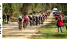
Dépt. 47 - XC

Le Championnat départemental a lieu le 15 mai. Le cyclo sport est une des pratiques les plus développées dans le Lot-et-Garonne. Philosophie de l'Ufolep : « l'accès au sport pour tous, la citoyenneté, la solidarité ». Le premier but recherché est l'effort sportif et le dépassement de soi.