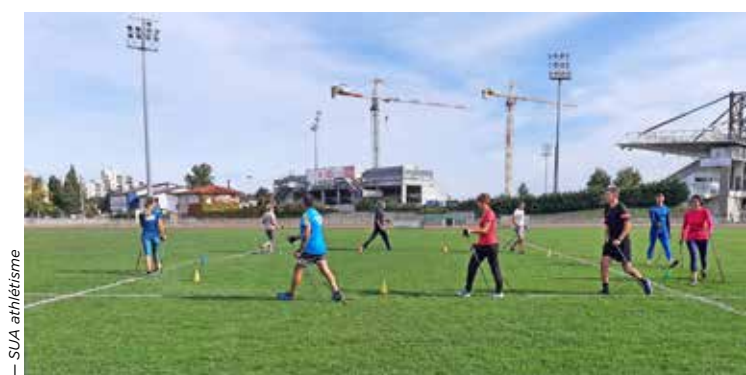
— SVA athlétisme