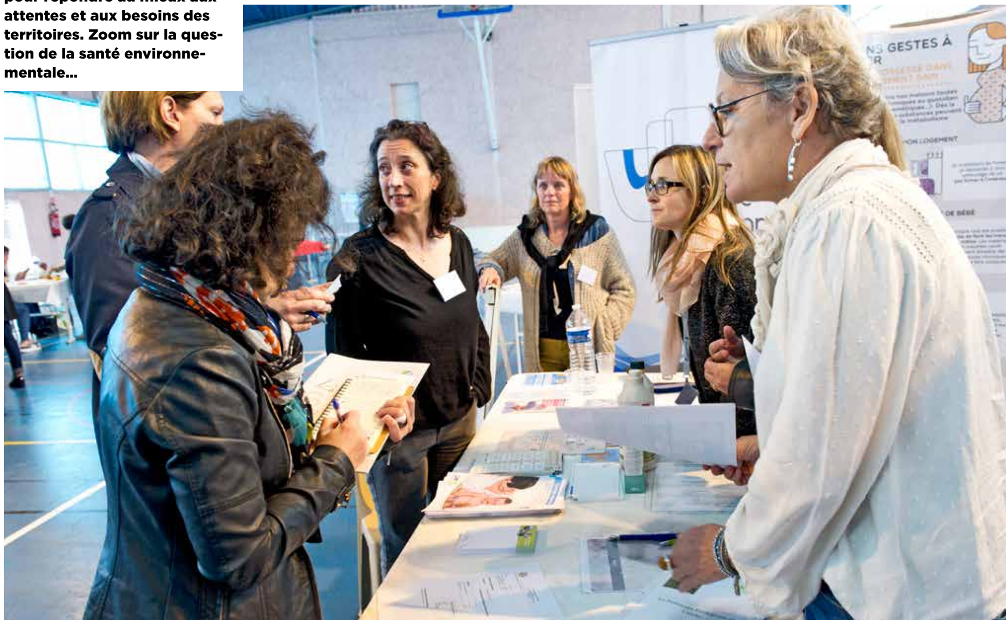
Le stand « santé environnementale » a donné des conseils précieux aux professionnels de la petite enfance.