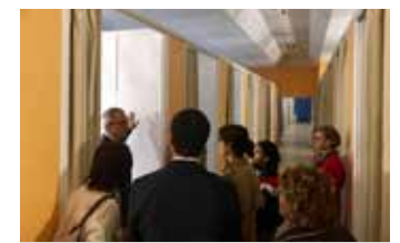
Collège Chaumié à Agen. Tour de l'établissement et rencontre des personnels départementaux, avec monsieur le principal.