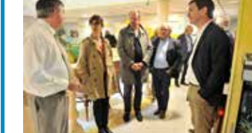
Sos. Visite de la maison de retraite et rencontre avec le personnel administratif et les résidents.