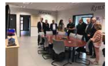
Foulayronnes. Visite du Centre de traitement et de régulation des appels d'urgence.