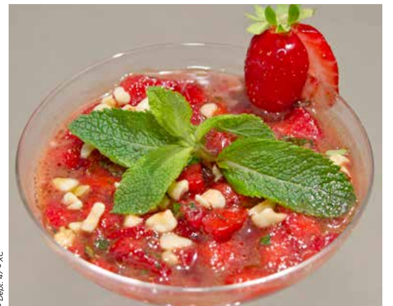
— Dépt. 47 - XC