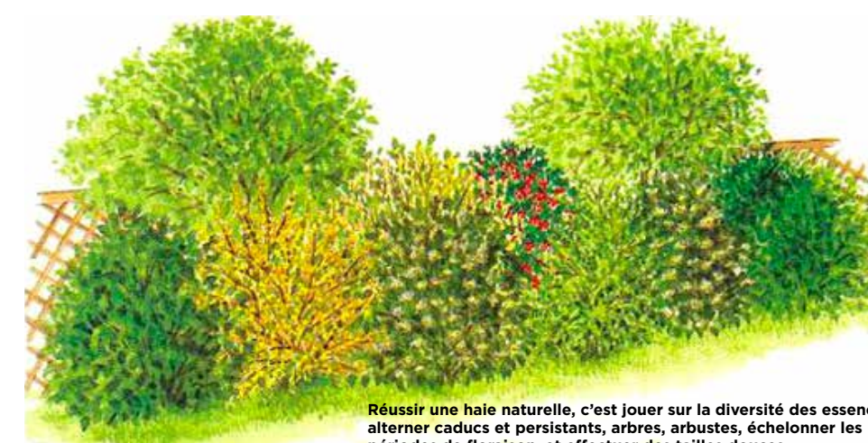
Réussir une haie naturelle, c'est jouer sur la diversité des essences, alterner caducs et persistants, arbres, arbustes, échelonner les périodes de floraison, et effectuer des tailles douces.

Malmenée par les opérations de remembrements des années 1950 à 1980, la haie s'est peu à peu effacée des paysages. Pourtant, elle joue un rôle crucial ! Aussi, le Département soutient la replantation de haies champêtres. Depuis plus de 25 ans, près de 200 km de haies ont ainsi été plantés grâce au programme L'arbre dans le paysage rural*. Les haies mono-spécifiques (une seule essence, des thuyas par exemple) ne sont plus à la mode et n'ont que des inconvénients : impénétrables, stériles, sensibles aux maladies et nécessitant des tailles fréquentes. Vive le retour de la haie « naturelle » !