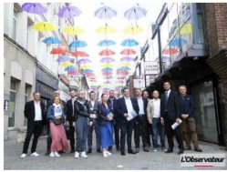
samedi 11 juin 2022 à 7h07min