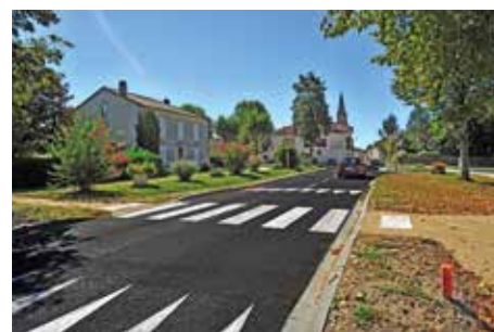
Interventions du Département : PIG Habiter ++ et aménagement de traverse de bourg