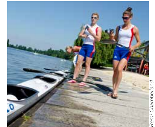
La base nautique du Temple-sur-Lot candidate pour devenir centre de préparation.

En parallèle, la base nautique du Temple-sur-Lot et les complexes sportifs de Villeneuve-sur-Lot et d'Agen sont candidats pour intégrer la liste officielle des Centres de préparation aux Jeux (CPJ). L'enjeu