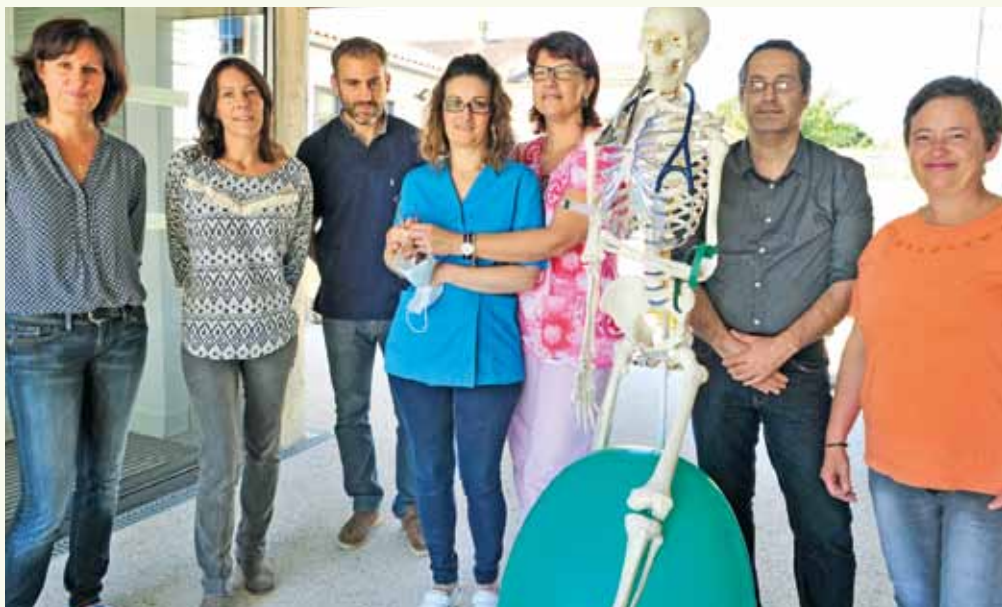
Maison de santé pluriprofessionnelle de Monflanquin